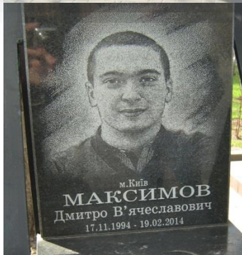
Меморіал Героїв Небесної Сотні. Київ, вулиця Інститутська.