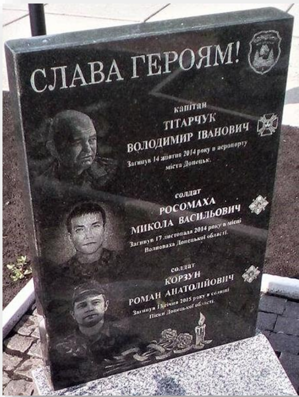
Меморіальна дошка трьом героям на фасаді Чернігівської гімназії № 31