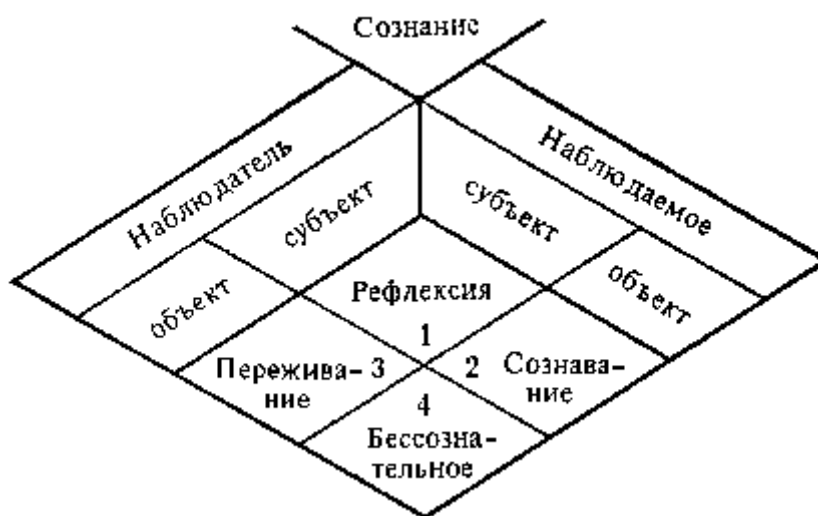
Типология режимов функционирования сознания.

В итоге этого рассуждения мы получаем категориальную типологию, указывающую на место переживания среди других режимов функционирования сознания.