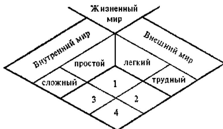
Типология жизненных миров.

Структура этой типологии такова: "жизненный мир" является предметом типологического анализа. Он имеет внешний и внутренний аспекты, обозначенные соответственно как внешний и внутренний мир. Внешний мир может быть легким либо трудным. Внутренний — простым или сложным. Пересечение этих категорий и задает четыре возможных состояния, или типа "жизненного мира".