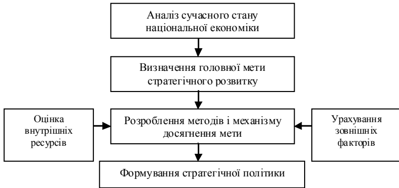
Рис. 1.1. Схема формування національної стратегії економічного розвитку

Реалізація стратегічних цілей досягається звичайно за допомогою таких заходів, як контроль за рівнем цін та доходів; підтримка пріоритетних галузей і компаній; антимонопольна політика; регіональна політика; регулювання валютного курсу; податкова політика та ін.