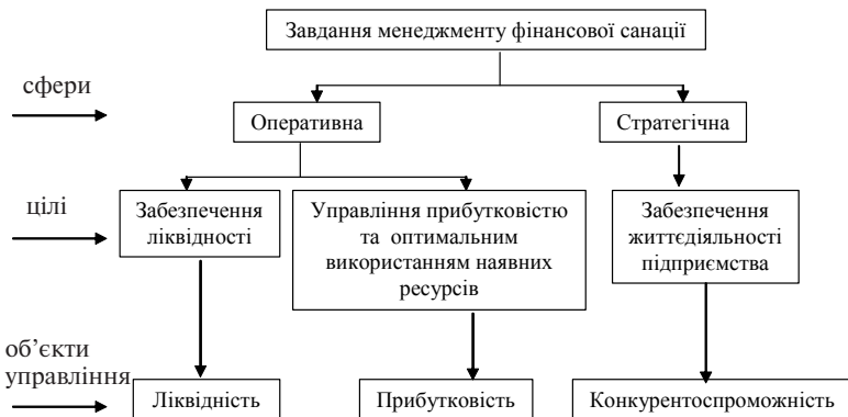
Рис. 1.2. Завдання менеджменту фінансової санації підприємства

Безперечно, що кожен випадок фінансової кризи потребує індивідуального підходу до управління процесом її подолання.