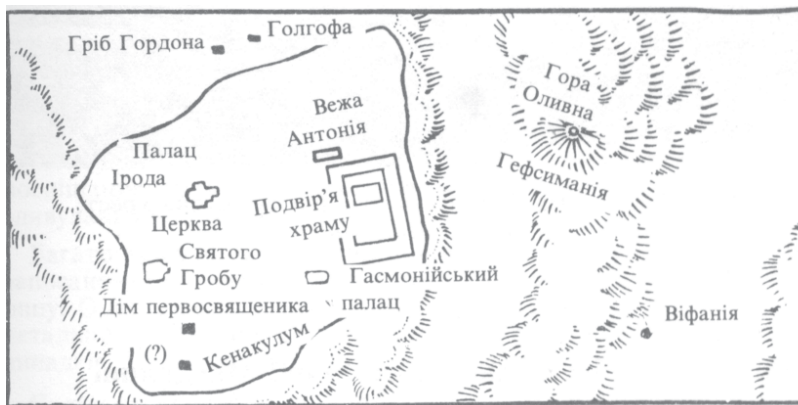
План давнього Єрусалиму

Власне кажучи, нова ера і бере свій початок з часу народження Ісуса Христа. Такий порядок літочислення був запропонований у VI ст. н.е., до цього всі країни Середземномор'я вели його від заснування Риму. За цим літочисленням народження Ісуса Христа відбулося в 752/753 році від заснування Рима (1 рік нової ери).