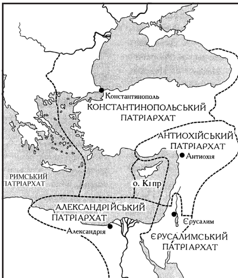
П'ять давніх патріархатів — устрій ранньої Християнської Церкви

Найвпливовішою залишалася столична Римська єпархія. За підрахунками одного з тодішніх єпископів Рима, у Вічному місті на 1,5 млн жителів налічувалося від 30 до 50 тис. християн і співчуваючих, 46 пресвітерів і 150 прислужників нижчого рангу; християнська громада надавала допомогу і піклування 1500 вдовам і сиротам. Усього ж, на думку вчених, християни склали максимум 10—15% населення Римської імперії. Свої претензії на пануюче становище серед