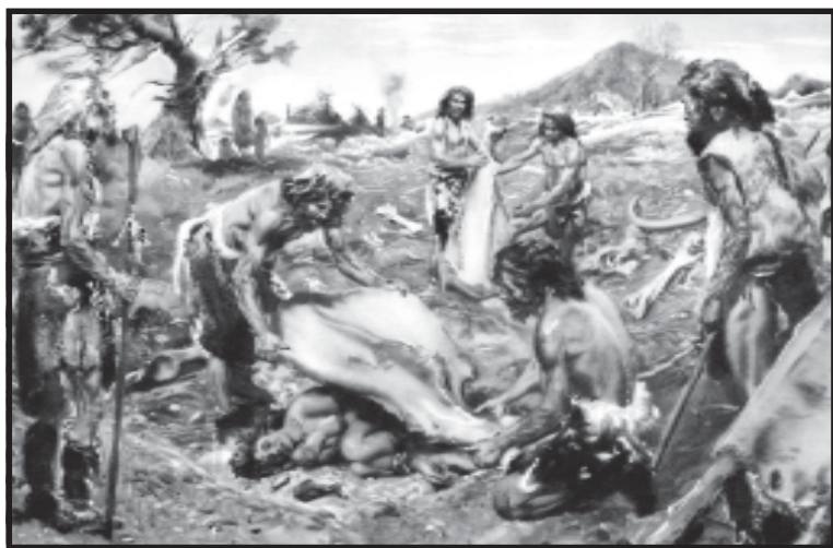
Поховальний обряд давньої людини

Виникнення цього культу пов'язується з часів З. Фрейда з двома напівінстинктивними прагненнями людини — і позбутися померлого, і зберегти його біля себе. Співіснування цих суперечливих прагнень проглядається у певній плутанині, що супроводжує поховальні обряди й звичаї різних народів у більш пізні часи: то небіжчика ховали якнайближче до будинку, то влаштовували поховання в найнедоступніших місцях, то плакали за ним, то навпаки— висловлювали жалобні почуття сміхом і оплесками, носили як жалобний то чорний, то білий одяг.