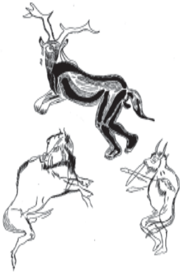
Наскельне зображення первісного шамана (?).

Шаманізм добре описаний на матеріалі мисливських і рибальських народів Північної Америки, Сибіру і Далекого Сходу. Відомі і наскельні зображення, що зазвичай співвідносять із шаманізмом (зображення в печері «Трьох братів» у Франції танцюючої людини з рогами оленя, хвостом, довгою, ймовірно, штучною бородою).