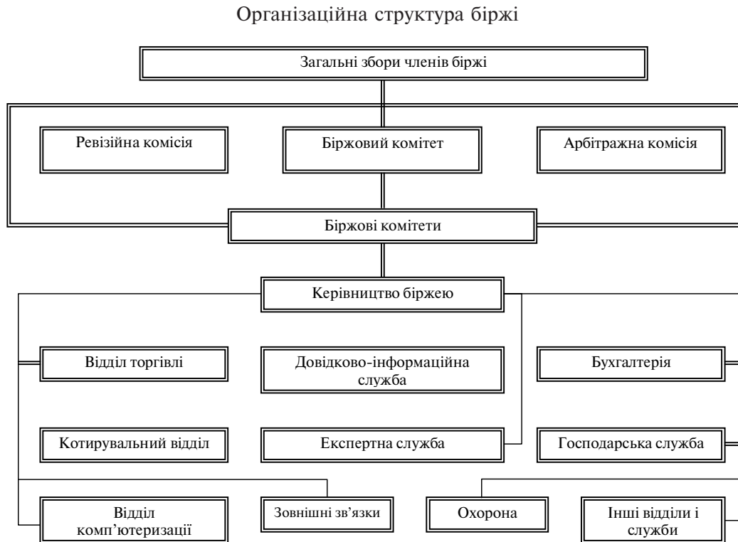
Схема № 1.1.