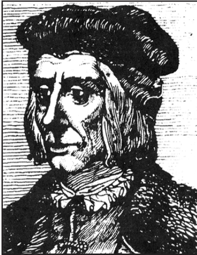
Рис. 6.7. Юрій Дрогобич

Магістр Краківського університету Павло Русин з Кросна викладав римську літературу, започаткував гуманістичний напрям в українській та польській поезії. Станіслав Оріховський – видатний філософ, який вперше обґрунтував ідеї гуманістичної політики і свободи, визначивши їх засади, – закон, законопослух і правопорядок.