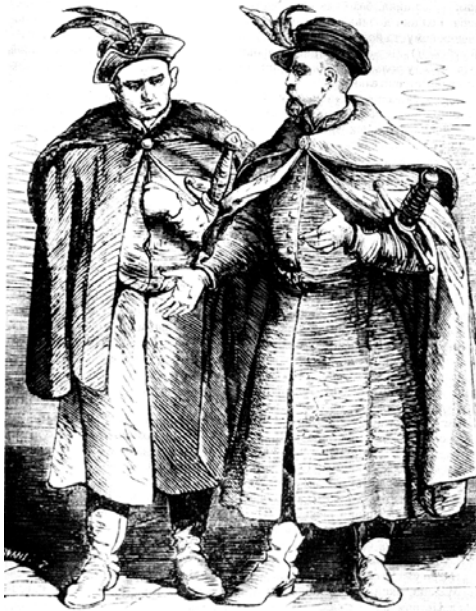
Рис. 6.5. Польська шляхта у XVII ст. Малюнок Ю. Коссака. Кінець XIX ст.

А що ж пан Лащ? За переказами, зазначеними вище, він підшив собі плащ, з'явившись у ньому при дворі короля Владислава IV, нарікаючи, що на підкладці є ще вільне місце, але біда – вироків не вистачає. Поліції на той час у країні практично не існувало, і примусити шляхтича, який мав підтримку магнатів, підкорятися вироку суду було безнадійною справою.