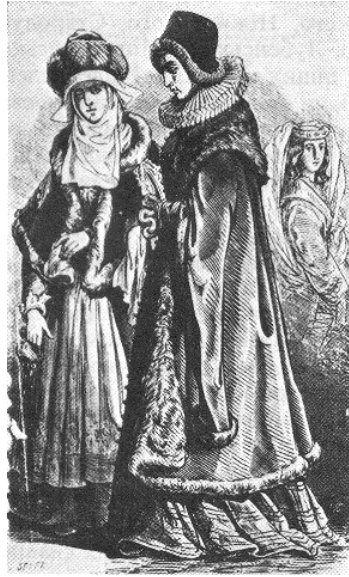
Рис. 6.4. Шляхтянки. XVI ст.

Широчезні території латифундій вкривалися резиденціями, великопанськими дворами, дворами адміністраторів, агентів, шляхти, службовців. Магнати роздавали від себе ділянки своїм службовцям та слугам «до волі своєї» – на ленному праві. Гуртуючи біля себе неспокійну шляхту, магнати тримали у страху місцеве населення, здійснювали набіги, або, як їх називали, «наїзди» на міста і села, грабуючи і розорюючи їх. Органи королівської влади були безсилі приборкати сваволу магнатів. Прикладом може бути справа Самійла Лаща-Тучапського, патроном якого був магнат Станіслав Конецпольський. Пан Лащ, маючи власний загін із тисячі відчайдушних голворізів, яких сучасники називали людьми «з пекла родом» , здійснював «наїзди» на маєтки сусідів, грабуючи їх. За свідченням хроніста Йоахіма Єрлича, Лащ був 236 разів засуджений за кримінальні злочини, 37 разів суд позбавляв його шляхетської честі і 28 разів присуджував до вигнання за межі держави.