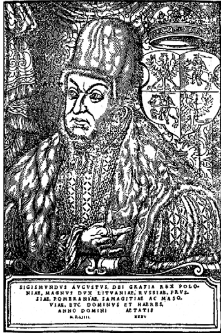
Рис. 6.2. Сигізмунд II Август (1548–1573).

7. Як це не здається парадоксальним, саме Люблінська унія, а точніше національно-релігійна дискримінація, що почалася від правління Сигізмунда III, згуртувала до боротьби за свої права і православну віру український народ та спонукала його (на середину XVII ст.) до усвідомлення необхідності створення своєї держави.