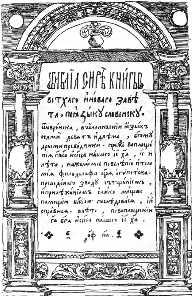
Рис. 6.9. Острозька біблія (1581 р.: заголовний листок)

У 1616 р. у друкарні Віленського братства створено «Граматикую словенскія правильное синтагма» Мелетія Смотрицького. Майже до кінця XVIII ст. вона була основним підручником з граматики у школах України, Білорусії, Росії, Болгарії та Сербії. Вона перевидавалася у 1648, 1721, 1723, 1755 рр. («Граматикою» користувався російський вчений М. Ломоносов).