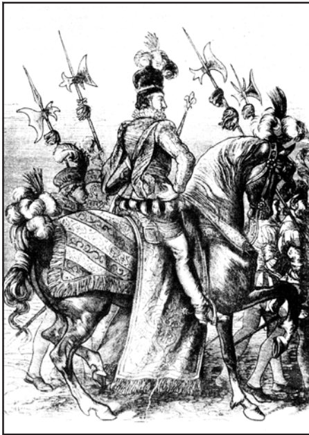
Рис. 6.3. Вийзд польського короля. Малюнок Ю. Коссака. Кінець ХІХ ст.

них пресією державної влади й тяжких політичних обставин ». І. Огієнко (митрополит Іларіон) вважав 1569 р. «найтрагічнішим роком нашої історії». На думку частини польських дослідників першої половини ХХ ст., у Любліні відбулося «возз'єднання частини зі своїм цілим, члена зі своїм тілом та головою». М. Сівіцький у книзі «Історія польсько-українських конфліктів» (1992 р.) вважає, що включення України до складу Польщі відбувалося парламентським, тобто правовим шляхом. Але політика інкорпорації визнається автором помилковою. Серед наслідків Люблінської унії він називає полонізацію українського населення, зокрема, шляхти.