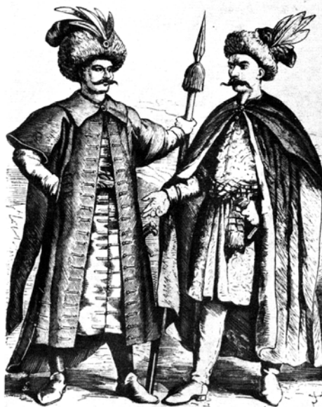
Рис. 6.1. Шляхта сеймова у XVII ст. Малюнок Ю. Коссака. Кінець XIX ст.

Відносини між державами погіршувалися, і це загрожувало війною. Крім того, часті конфлікти ускладнили фінансовий стан Литви, до того ж до загрози з боку Сходу в 40-х роках XVI ст. додалася і турецька. Країну роздирали і внутрішні протиріччя. Зміцнення фільваркової системи призвело до загострення стосунків між магнатами і шляхтою. В руках перших фактично знаходилося все судочинство і контроль за вищими адміністративними посадами, що викликало невдоволення в більшості шляхти. Вона обурювалася і системою військової служби та необхідністю платити податки. На перехресті знаходився і розвиток культури у Велико-