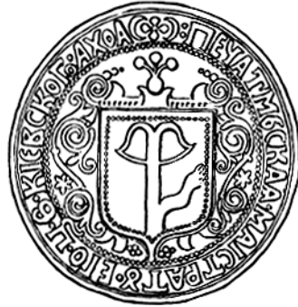
Рис. 5.7. Міська печатка Києва

Багато мешканців міст займалися сільським господарством. Водночас міста були важливими осередками ремесла. Ремісники об'єднувалися в цехи. Причини їх виникнення були ті ж самі, що й у Західній Європі: захист своїх інтересів у боротьбі проти свавілля адміністрації, феодалів та конкуренція між міськими й сільськими ремісниками. Перша згадка про ремісничі цехи в Україні датована 1386 р., коли була видана цехова грамота для шевців м. Перемишля. Наприкінці XV ст. у Львові було 500 ремісників, 36 спеціальностей, у Києві – 20 спеціальностей. Усього на початок XVI ст. в українських містах налічувалося 150-200 ремісничих спеціальностей. Усі цехи мали свій статут, суд, свої свята, святих, прапори, до їх складу входили майстри, підмайстри, учні. На чолі стояв виборний цехмістер. Кількість майстрів була обмеженою. Підмайстер міг стати майстром, склавши іспит, подавши шедевр (зразок виробу) і оплативши вступний внесок.