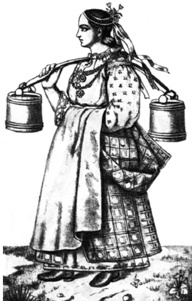
Рис. 5.6. Українська селянка. За Рігельманом

На відміну від Польщі, де фільваркове господарство набуло більшого поширення, в Україні цей процес проходив повільніше. Для існування таких господарств суттєво необхідними були доступ до зовнішніх ринків та значна робоча сила. У першій половині XVI ст. фільварки виникли в Галичині, Волині, Поділлі. У другій половині XVI ст. вони розвинулися у Закарпатті та Подніпров'ї. Найбільші фільварки мали по 400-600, середні – по 100-250 га орної землі. Розширювалися вони за рахунок «купівлі» селянської землі, пусток, утворених після втечі селян і набігів кримських татар, луків і пасовищ.