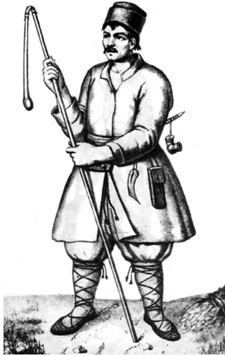
Рис. 5.3. Литовський селянин. За Рігельманом

Третю групу складали « тяглі селяни ». Вони вели господарство на землі, що належала феодалу, і відбували відробіткову ренту (панщину) . Крім праці в полі, виконували грошові та натуральні податки на користь пана та держави, виконували також державні повинності (будування мостів, ремонт шляхів, охоро-