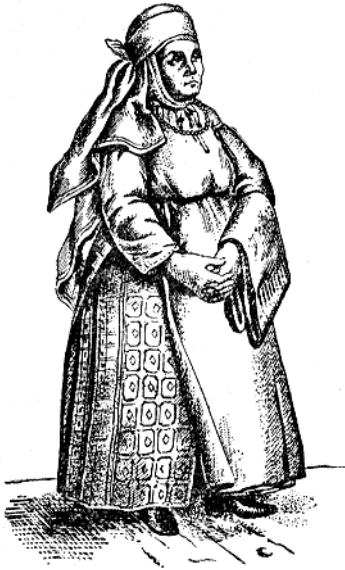
Рис. 5.4. Українська селянка. За Рігельманом

ну та ремонт замків тощо). В другій половині XVI ст. вони переходять у підданство землевласників.