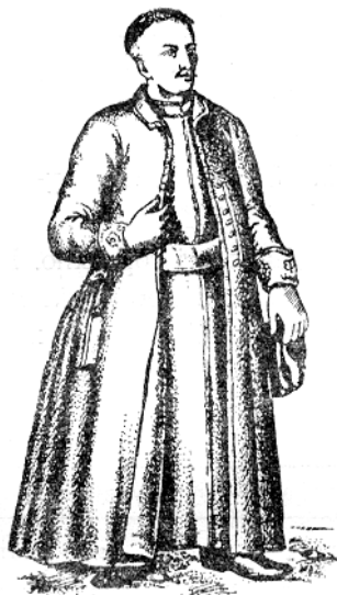
Рис. 5.2. Український міщанин. За Рігельманом

Міщани поділялись на три основні категорії: до першої категорії — «патриціату» — належала купецько-лихварська верхівка, цехові майстри, а також чільні урядники станового міщанського самоврядування і суду. Нечисленний, але впливовий патриціат фактично зосереджував у своїх руках всю владу. До другої категорії — «бюргерів» — відносилися дрібні купці і торговці. Внизу соціальної драбини міста перебував міський плебс — позацехові ремісники (партачі), міська біднота, слуги.