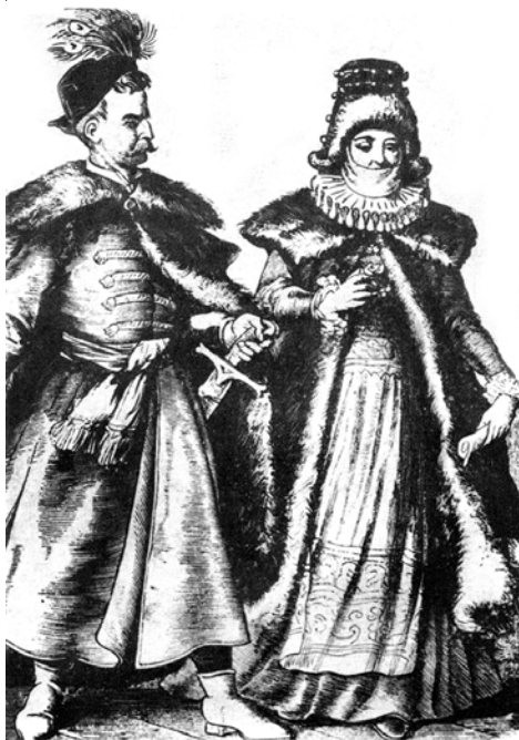
Рис. 5.1. Шляхтич і шляхтянка. Малюнок кінця XIX ст.

ня на сейм від великого князя (службові князі теж мали цей привілей); 3) використання для своїх печаток червоного (королівського), а не зеленого воску, яким користувалась решта шляхти.