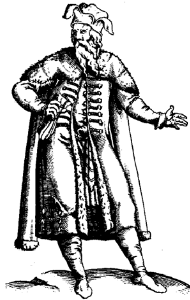
Рис. 5.8. Купець

Розвиток міст був тісно пов'язаний з розвитком торгівлі. Міста були центрами, де на торгах і ярмарках відбувався торговий обмін сільськогосподарською та ремісничою продукцією. Торги, що проходили один-два рази на тиждень, обслуговували місто та навколишню округу, перетворюючись на постійну торгівлю. Ярмарки проводились 1-3 рази на рік у період релігійних свят і тривали кілька днів, а то й тижнів.