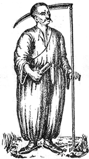
Рис. 5.5. Український селянин. За Рігельманом

Феодальна вотчина в цей час ділилася на фільварки, тобто власне господарство феодала, і землі, які він здавав селянам. Робота селян у фільварку називалася панщиною («тягловою службою»). Норми панщини зростали в міру розвитку фільваркового господарства. В 1424 р. в Галичині вона складала 14 днів протягом року. На Київщині в другій половині XV ст. її тільки почали вводити. До кінця XV ст. на українських землях норма панщини в середньому складала один день на тиждень, у середині XVI – два дні. Паралельно з панщиною залежні селяни повинні були давати і натуральний податок, і платити грошову данину – «чинш».