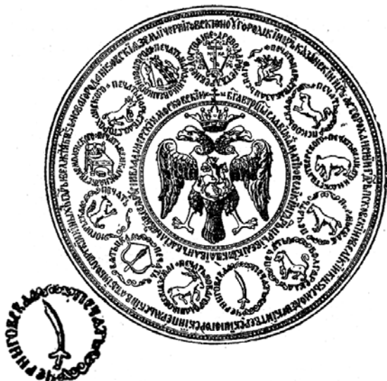
Рис. 4.8. Велика державна печатка Івана Грозного.

кандидатура Івана IV (Грозного), прийняття якої призвело до російсько-польсько-литовської унії. Кандидатура Івана IV була дуже популярна не лише серед українського і білоруського населення Речі Посполитої, але і широких кіл польсько-литовської шляхти, невдоволеної засиллям в Речі Посполитій магнатської олігархії.