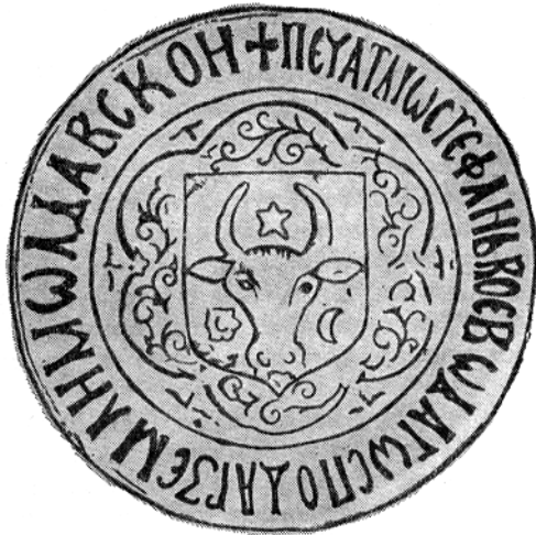
Рис. 4.5. Велика державна печатка Молдавії часів Стефана III (1457–1504).

У 1359 р. після утворення незалежного Молдавського князівства до його складу ввійшла Шипинська земля. Її територія тоді в основному збігалася з територією сучасної Чернівецької області. На заході вона межувала з підвладними Польщі українськими землями по р. Колочин, на півночі простягалася до Дністра, на півдні – до р. Серет, на сході – до р. Каютин. У складі Молдови Шипинська земля збере-