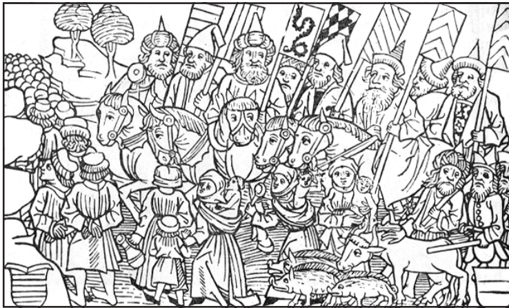
Рис. 4.4. Напад татар на Угорщину. Гравюра XVI ст.

Впродовж X-XI ст. Буковина перебувала у складі Київської Русі, в XII – першій половині XIV – Галицько-Волинської Русі. В цей час центрами земель були міста Василів, Городок, Сучава, Онут та ін. Під