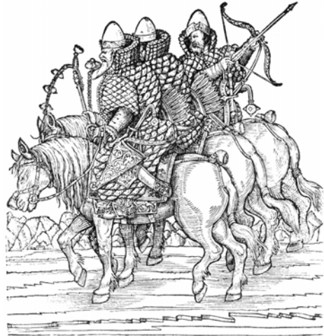
Рис. 4.10. Дворянська кіннота. Малюнок із «Записок» Герберштейна. XVII ст.

З самого початку авантюри утворилась сильна партія прихильників самозванця на «поле», а потім і на московських «украинах». У Чернігово-Сіверській землі агенти Лжедмитрія I уже в 1603 р. у мішках жита і пшениці, в човниках і обозах з різними товарами переправляли при заступництві польських прикордонних властей, через московські