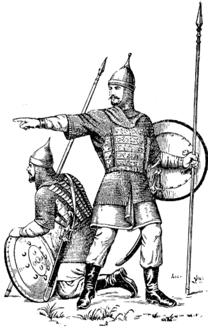
Рис. 4.7. Російські воїни XV–XVI ст.

Потрійний удар по Литві, про який писав С. Герберштейн, розвивався для Москви успішно. На півдні Яків Захар'їн, Іван Репня-