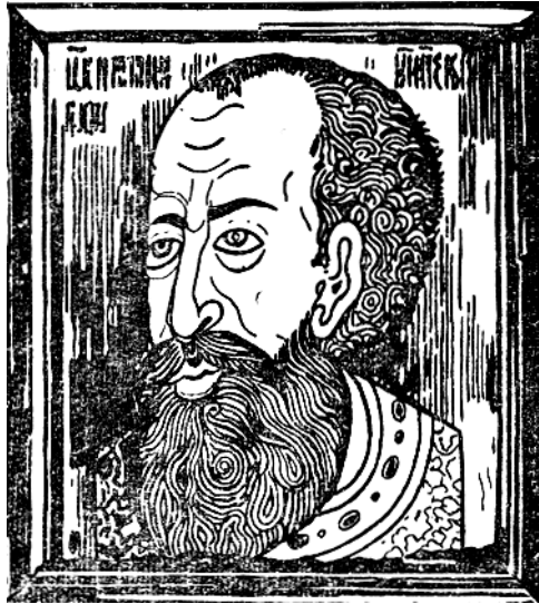
Рис. 4.9. Одне з найдавніших зображень Івана Грозного

Особливе становище невеликих прикордонних міст привертало сюди «гулящих людей» і біглих холопів, бо саме тут їм було легше всьо-