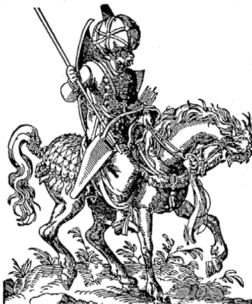
Рис. 4.3. Турецький вершник бехли. Зкниги XVI ст.

Крім угорських феодалів, з середини XIII ст. край колонізують зі сходу (з боку Семиграддя) волохи (румун), які засновували в гірських долинах села. Вони користувалися самоуправлінням (по «волоському праву»), сплачуючи землевласникові чинш (грошовий податок). Із