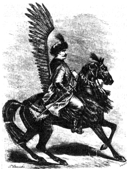
Рис. 4.1. Польський крилатий гусар

Похід тривав не більш як 3-4 тижні (15 травня Казимир III був уже в Кракові), і не змінив нічого в політично-державному устрої Галичини. Вона залишилася у номінальній владі литовського князя Любарта та Орди, а фактично влада належала боярській олігархії на чолі з Дмитром Дедьком.