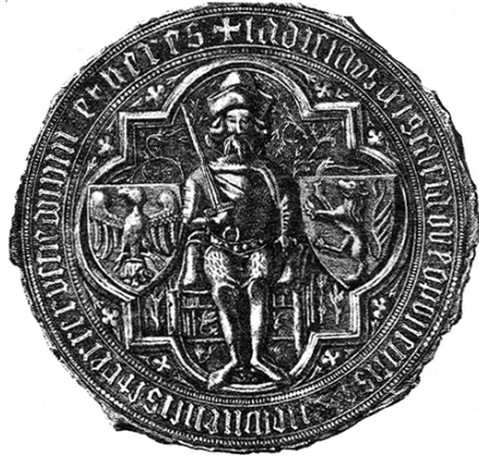
Рис. 4.2. Печатка Володислава Опольського, останнього Галицького князя

Черговий історичний поворот у долі Галичини стався 1370 р., коли помер останній польський король з династії Пястів – Казимир III. Разом з польською короною Людовіку угорському дісталася і Галичина. Литва, скориставшись смертю Казимира, захопила всю Волинь. У жовтні 1372 р. Галичина була передана у ленне володіння племіннику Людо-