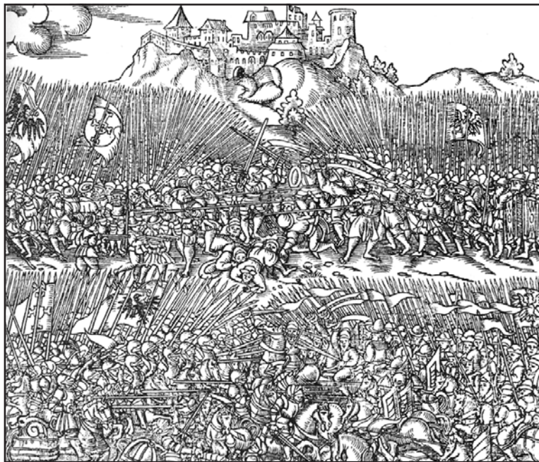
Рис. 3.5. Грюнвальдська битва. Фрагмент. Гравюра XVI ст.

Перемога у Грюнвальдській битві значно зміцнила позиції Литви. За Торунським миром (1411 р.) Тевтонський орден передав їй Жемайтію, а Польщі – Добжинську землю. Просування хрестоносців на схід було зупинене, і поступово Тевтонський орден зійшов з історичної сцени.