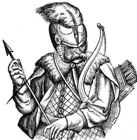
Рис. 3.6. Свидригайло (з гравюри XVI ст.)

землі, так і не здійснилася. Пам'ять про Вітовта і його діяльність надовго пережили самого князя. Легенди про його щедрість і хоробрість передавались з уст в уста, і нині Вітовт Великий – одна з найпопулярніших постатей в литовській історії.