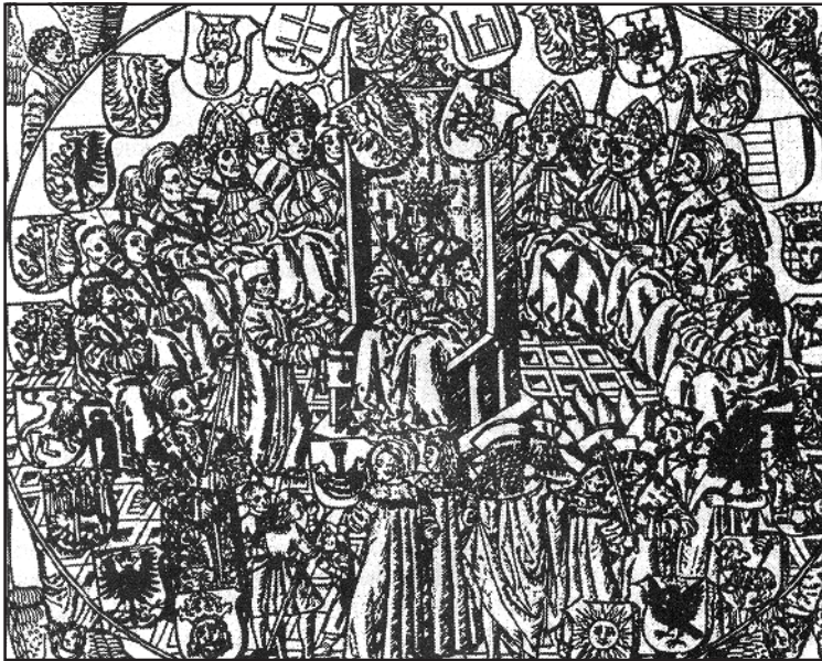
Рис. 3.9. Олександр Казимирович на засіданні сейму. Дереворит. 1506 р.

У розвиткові обох держав можна визначити багато спільного. І Московська, і Литовська склалися переважно на східнослов'янській основі, на державній території Київської Русі. Російські законодавчі пам'ятки XVI-XVII ст. використовували Литовські статuti, які в свою чергу відображали норми «Руської правди». До 1385 р. в обох державах православ'я було офіційною ідеологією, а руська мова була державною. Значна частина тодішньої московської еліти, включаючи впливових при дворі і в Боярській Думі князів Мстиславських і Бельських, вели свою родослівну від Гедиміна. На великій печатці Івана IV серед гербів підвладних царю земель був і «Колюмн» – родовий знак Гедиміновичів, який в Москві називався «полоцькою печаткою».