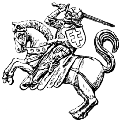
Рис. 3.4. Литовський воїн (герб Литви)

У той же час всередині Великого князівства не все було спокійно. Невдоволені політикою Вітовта, в 1406-1408 рр. переходять на службу