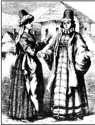
Рис. 3.8. Жіночі строї в Литві. Малюнок Ю. Коссака. Кінець XIX ст.

Щоб позбавити Свидригайла підтримки православної знаті, Ягайло і Сигізмунд відповідними актами — 1432 і 1434 рр. — зрівняли у майнових і особистих правах православних русько-литовських феодалів з литовцями-католиками. Великий князь зобов'язувався нікого з феодалів не карати без суду, тобто запроваджував елементи правової держави. Затяжна війна та надання привілеїв православним призвели до того, що вони почали переходити на бік Сигізмунда спочатку поодинокі, а потім і групами. Такі переходи спровокували розправи Свидригайла з невдоволеними.