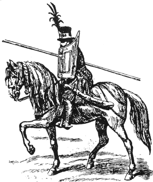
Рис. 3.10. Легко озброєний литовський вершник. З картини перемоги Костянтина Острозького під Оршею 1512 р.

Ставши великим князем литовським і королем польським, Сигізмунд I майже відверто виявив свою неприхильність до унії. Політична незалежність Литви як спадкового володіння гарантувала його нащадкам