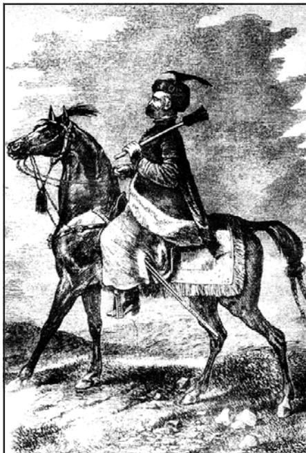
Рис. 3.7. Литовський ротмістр. Гравюра кінця XIX ст.

Як би там не було, політичний вплив Київського князівства на той час був великий. Семен Олелькович (син Олександра) називав себе «князем великого князівства свого... Київського» , а молдавський воєвода Стефан III, котрий у 1464 р. одружився з сестрою Семена Євдокією, навіть називав його «київським царем» . Семен Олелькович, од-