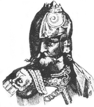
Рис. 3.1. Великий литовський князь Гедимін

Встановлення влади литовських князів у тих чи інших землях далеко не завжди проходило гладко. У Гедиміна були суперники: і відсторонені представники місцевих династій, і частина боярства, і прості мешканці, які боялися змін і хотіли жити по-старому. Але в цілому розширення Великого князівства проходило порівняно спокійно, бо приєднання земель до цієї держави задовольняло найбільш впливові кола місцевого населення: боярство, городян, церкву.