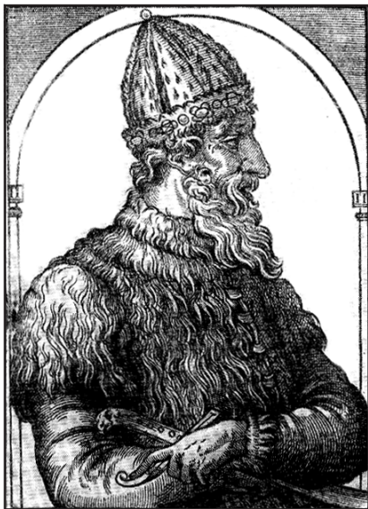
Рис. 3.10. Іван III – «государь всея Русі». Гравюра з книги А. Теве. XVI ст.

У кінці XV – на початку XVI ст. проходить соціально-економічний спад у Литві, а на українських землях поширюються проросійські настрої. У цей же час зміцнюється Московське князівство. Консолідуючи навколо себе навколишні землі, воно трансформувалося в єдину централізовану Російську державу. З поваленням у 1480 р. ординського іга Москва все гучніше й активніше заявляє про себе як про «центр збирання земель руських». Вже 1489 р. Іван III вперше заявив литовському князю та королю польському Казимиру IV: «Наші міста і волості, і землі, і води король за собою тримає» .