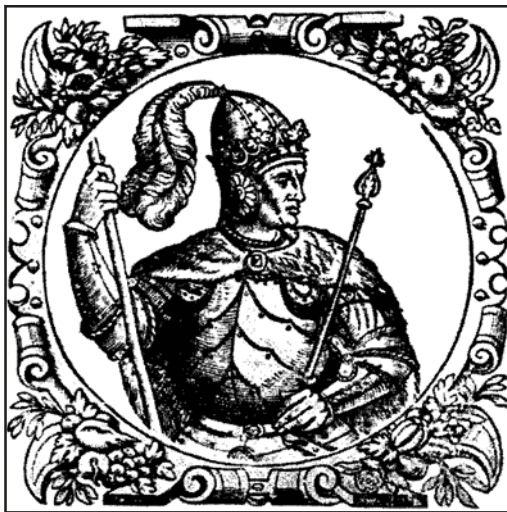
Рис. 3.3. Великий литовський князь Вітовт

ких військ вона у 1387 р. остаточно відвоювала в Угорщини Галичину і встановила владу над Молдавським князівством. Під тиском польських панів Ягайло приєднав Галичину не до Литви, а до Польщі, зобов'язавшись навічно зберігати її «собої, Ядвізі, дітям і короні польській».