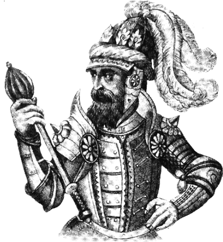
Рис. 3.2. Великий литовський князь Ольгерд

Протягом 70-х років особливо швидко відновлювалося життя у Київському князівстві, чому сприяла діяльність князя Володимира Ольгердовича. Розширювались територіальні межі князівства. За короткий час воно приєднало до себе Переяславщину, частину Чернігово-Сіверщини й простяглося від Південного Бугу, Тетерева і Случі на заході до