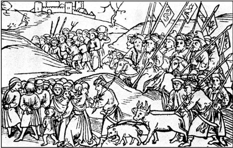
Рис. 2.4. Татари женуть полонених з Галичини і Волині

від інших територій Південно-Західної Русі, перебувало під безпосереднім правлінням ординської адміністрації. Ці землі Ногай підкорив своїй владі у 60-70-х роках XIII ст. під час походів на Візантію і Болгарію.