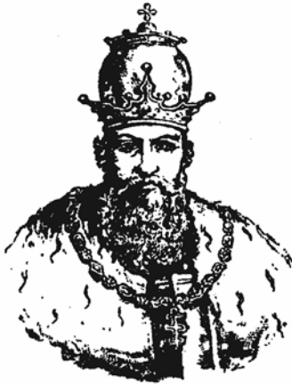
Рис. 2.1. Король Данило Галицький

Північно-Західною Європою. Крім того, ця територія могла стати плацдармом для подальшого захоплення слов'янських земель. Данило Романович одразу зрозумів усю небезпеку обставин, що склалися на той момент. «І сказав Данило: «Не личить крижевникам (хрестоносцям) тримати нашу отчину. І пішов на них з великою силою», – писав галицький літописець.