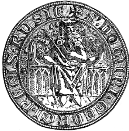
Рис. 2.5. Печатка Юрія Львовича, уживана Юрієм-Болеславом (напис: s. domini regis rusie, «Печатка володаря Георгія, володаря Русі» )

Водночас, союз з Орденем був спрямований проти намірів ли-