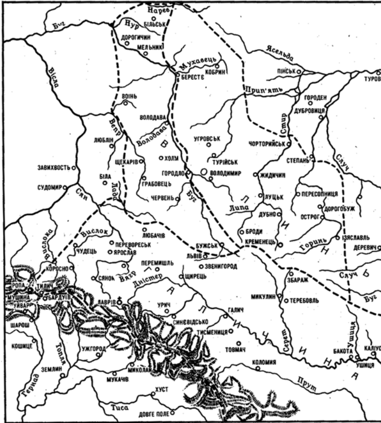
Мал. 2.2. Галицько-Волинська держава XII-XIVст.

видали ярлик на Володимиро-Суздальське князівство, оминувши його старшого брата Олександра (Невського), відомого державного діяча