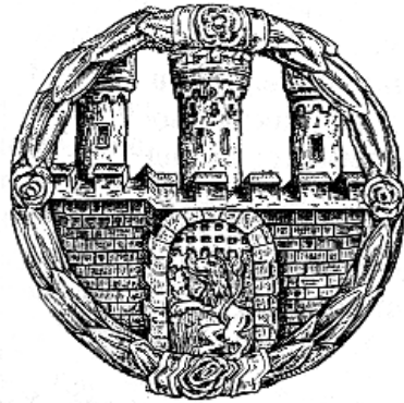
Рис. 2.7. Герб Львова. З печатки 1353 р.

Так була втрачена перша можливість для створення української національної держави.