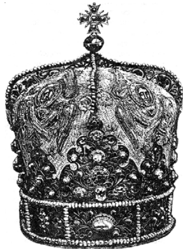
Рис. 2.3. Митра владича перемисььська, про яку переказують, що її нібито перероблено з Данилової корони

У 1253 р. папа Римський оголошує хрестовий похід проти монголів, до участі в якому закликає Польщу, Чехію, Померанію та Сербію. Проте через низку причин (більшість країн були втягнуті в бо-