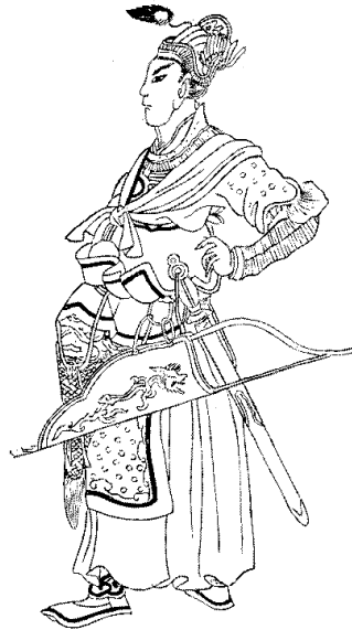
Рис. 1.3. Бату-Хан (Батий), онук Чингізхана, засновник Золотої Орди

У Чернігівській землі княжий устрій уцілів, особливо у північній і польській її частинах. Центральні, ще недавно найбільш багаті, райони князівства швидко безлюдніли. За даними В. Коваленка, кількість сільських поселень у регіоні в цей час, порівняно з попереднім періо-