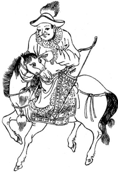
Мал. 1.6. Кінний монгол. Мал з китайської енциклопедії XVII ст.

4. Військові особливості. Слов'янські князі разом зі своїми військами змушені були брати участь в різних військових кампаніях монгольських ханів. Крім того, тисячі слов'ян регулярно призивались до монгольської армії. Більша частина рекрутів періодично відправлялися в Орду і Китай, але частина з них залишалась для місцевих потреб і служила в загонах баскаків. А. Насонов вважає, що набір до монгольської армії був проведений вже 1238–1240 р.р., і в західному поході 1241 р. в армії Батія діяли слов'янські полки. Відбірний загін слов'янських воїнів охороняв ставку хана в столиці Орди – Сарай-Бату. У хроніці Матвія Паризького наведено лист двох ченців, в якому повідомлялося, що в монгольській армії «много куманов и псевдохристиан», тобто православних.