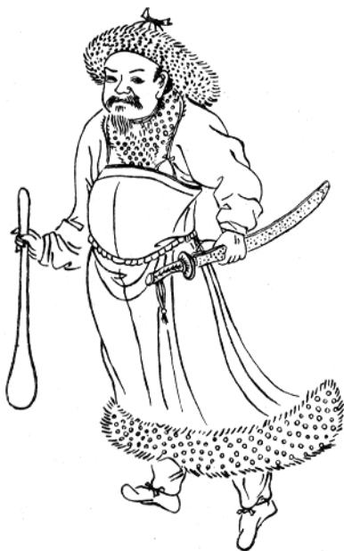
Рис. 1.4. Піший монгол

Даруги, які служили на Русі, в літописах іменувалися «баскаками». Це тюркський термін, значення якого повністю відповідає монгольському «даруга». Кожен баскак мав у своєму розпорядженні військовий підрозділ для утримання порядку і дисципліни в районі. В цих загонах служило й місцеве населення. Кожному баскакському підрозділу відводилося постійне житло, що з часом стало провітаючим поселенням і називалося «татарською слобідкою» (мешканці не сплачували податків). Сліди таких поселень збереглися в топоніміці України.