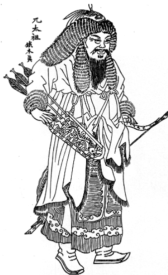
Рис. 1.1. Чингізхан

крило. Кожна з них ділилася на «тьми» (10 тисяч). Кожна «тьма» – на «тисячі», «тисячі» – на «сотні», «сотні» – на «десятки» на чолі з темниками, тисячниками, сотниками, десятниками. Найбільші адміністративні одиниці керувалися братами і синами Чингізхана. Ханом міг бути тільки чингізид.