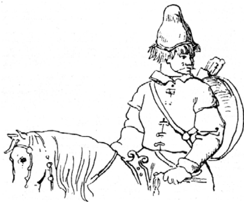
Мал. 1.5. Татарин. Мал. А. Дюрера початку XVI ст.

2. Економічні особливості. Масові спустошення, податки і повинності, накладені загарб-