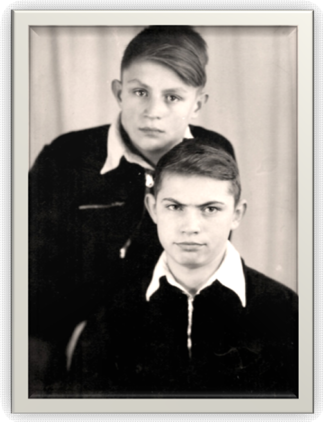
. ( ), , 1957