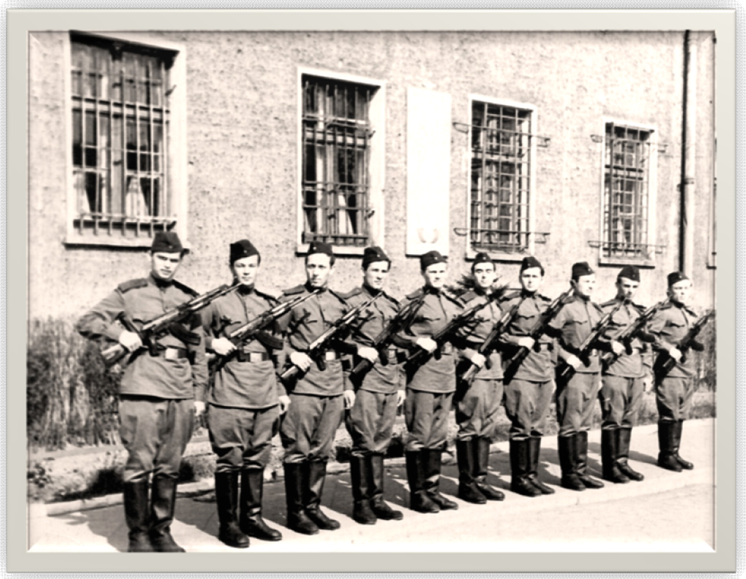
. . ( ) . , 1963