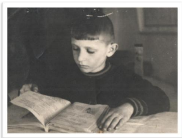
Перший раз у перший клас