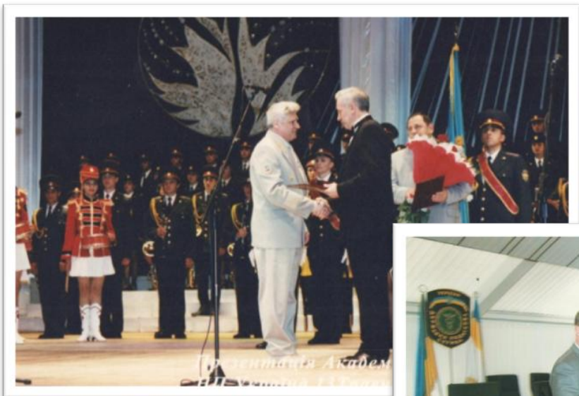
Присвоєння почесного звання «Заслужений працівник освіти». Київ 2000 рік