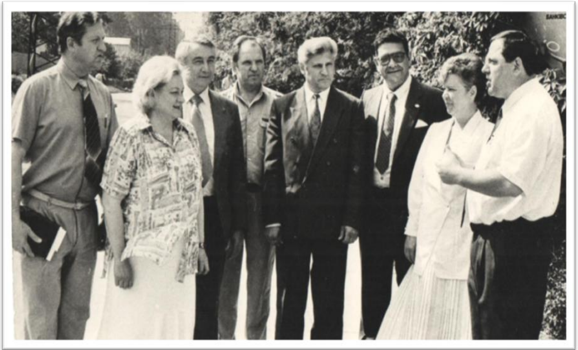
На зустрічі з активом Ірпеня. 1994 рік

планів та програм, формуванням кафедр та іншої документації щодо відкриття вищого навчального закладу – інституту на базі Ірпінського індустріального технікуму. До складу Центру входило відділення коледжу. 1994 року був першим заступником директора коледжу.