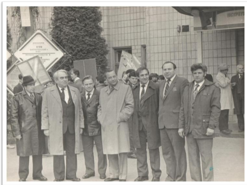
Завідувач відділу «Обробка металів різанням» з колегами