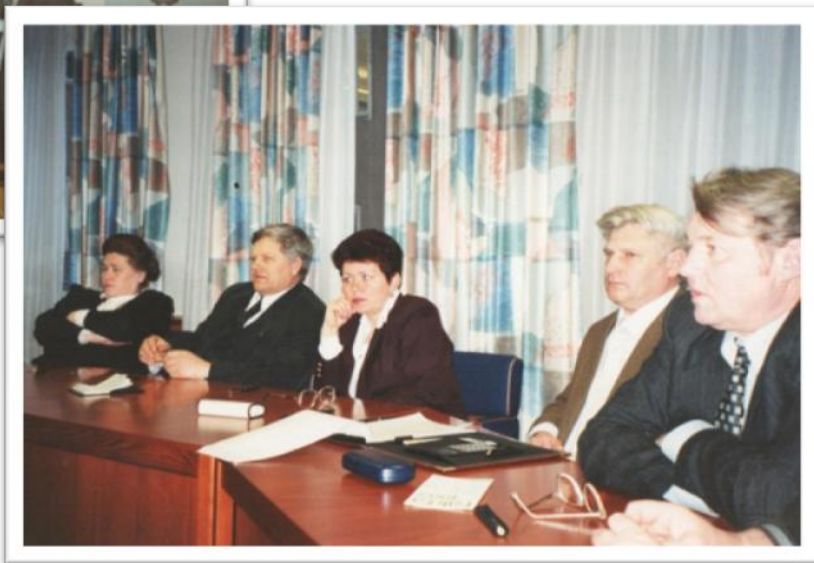
Швеція 1998 рік

З 1998 року по 2005 рік працює першим проректором Академії державної податкової служби України. А в період з 1998 по 2000 рік – виконує обов'язки ректора Академії.