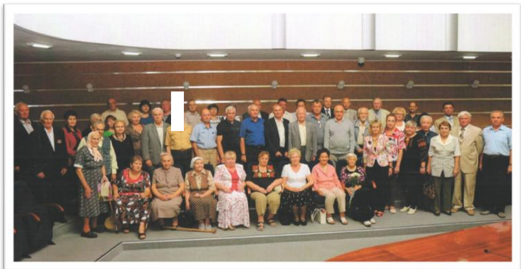
Зустріч з ветеранами університету