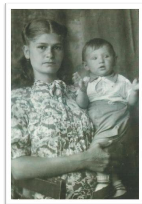
Найнадійніше місце – у мами на руках