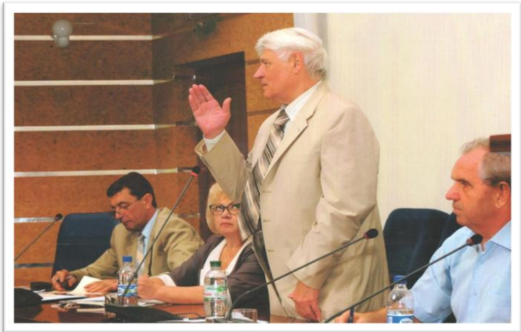
Голова Ради ветеранів