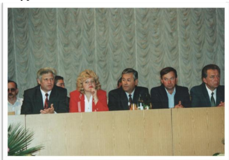
Завідувач Центру інженерно-економічної підготовки

З 1991 року він працював завідувачем Центру інженерно-економічної підготовки, який займався розробкою та затвердженням перехідних навчальних