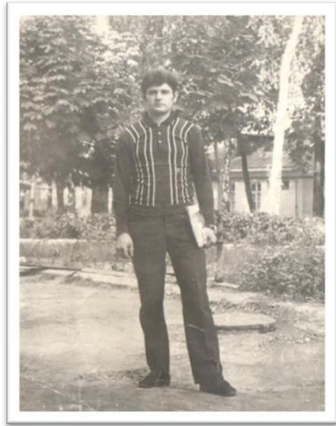
Період роботи на Криворізькому металургійному комбінаті (1966-1968 рр)

1966 року після служби в армії повернувся на Криворізький металургійний комбінат де до 1968 року працював підручним сталевара.