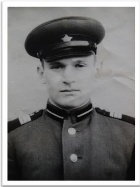
Служба у лавах Радянської Армії (1963-1966 рр)

У вересні 1963 року його призивають на службу до лав Радянської Армії. Армійську службу проходив по грудень 1966 року у Групі Радянських військ у Німеччині.