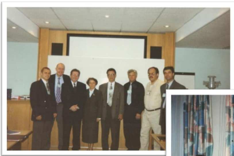
Англія 1997 рік