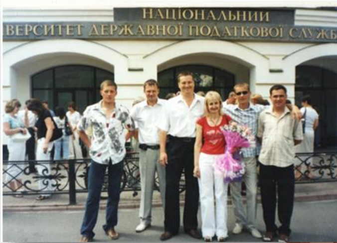
Випускники групи СПГ-41 завітали на зустріч через 5 років, 1995 рік