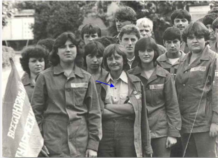
Комісар студентського загону, 1983 рік 1