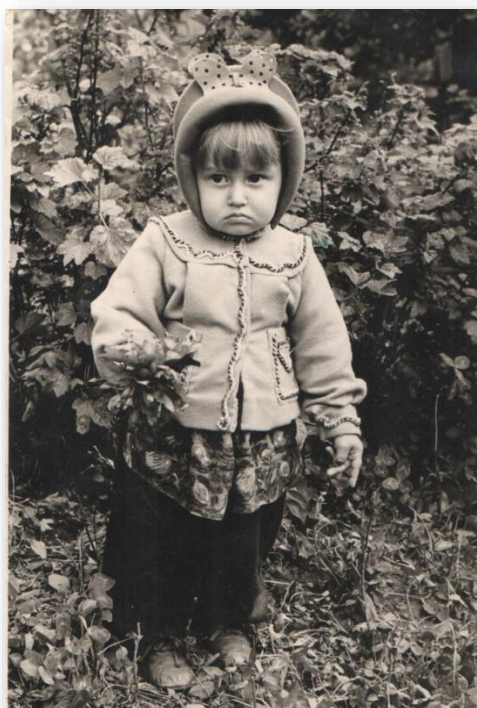
Роззублена і здивована, 1962 рік