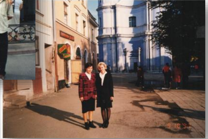
Івано-Франківськ, апробація наукового дослідження на Міжнародній науковій конференції, 1997 рік