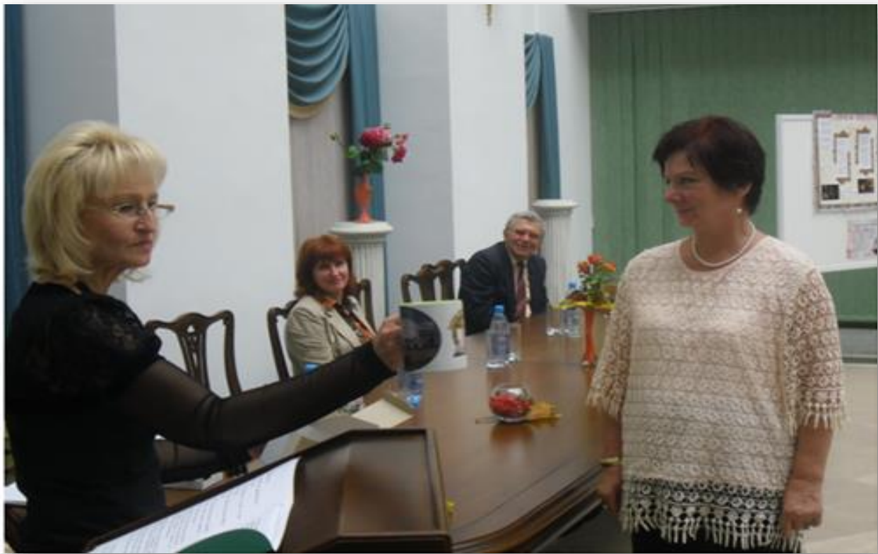
Всеукраїнський день бібліотек. Вручення почесних грамот та цінних подарунків кращим працівникам бібліотеки, 2012 рік