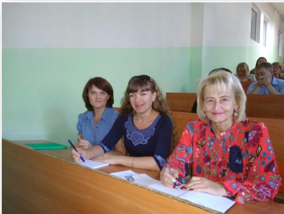
Вересень, 2018 рік. Грандрайтинг. Курс навчальних занять щодо шляхів пошуку грантових програм