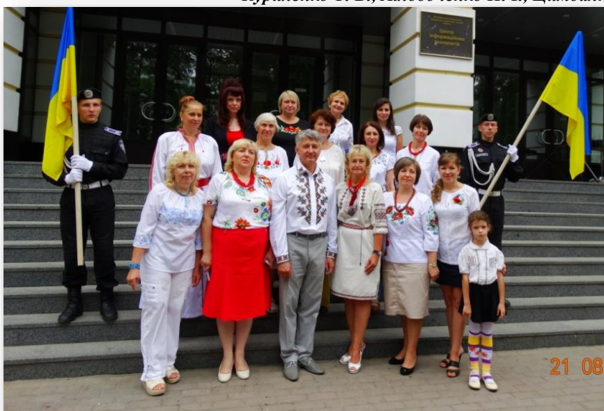
Флешмоб до Дня Незалежності України, 2015 рік