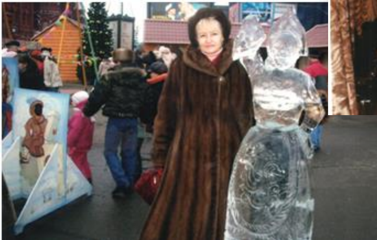
Москва. Красна площа, виставка льодових скульптур, 1998 рік