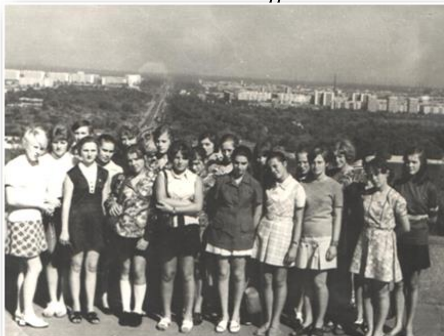
І курс Ірпінського індустріального технікуму. Група ПІІ-11, 1975 рік