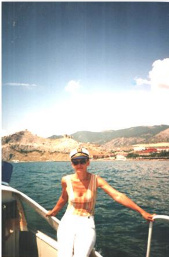
Хобі – пізнавати світ: Крим, Царська бухта, 2004 рік