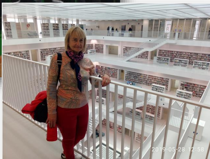
У міській бібліотеці Штудгарта, що входить до двадцяти п'яти найкрасивіших та найоригінальніших бібліотек світу, 2019 рік