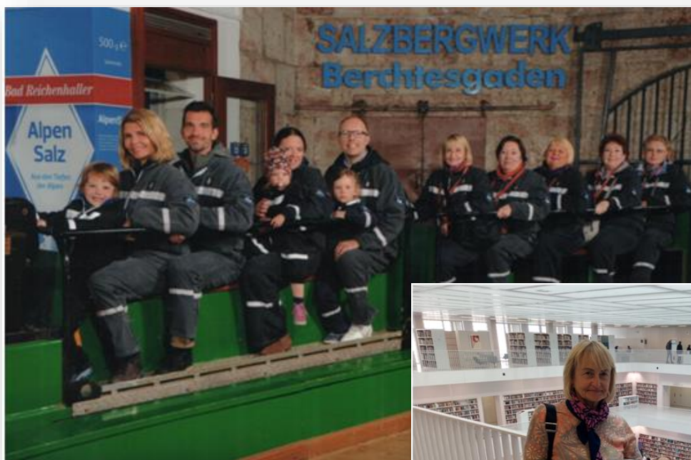
Знайомство з родзинкою Зальцбурга. Соляна шахта-музей, 2019 рік