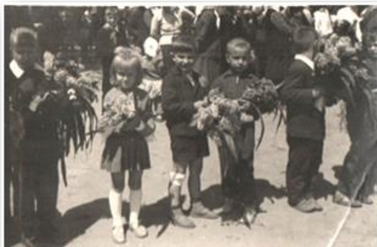
Незабутній перший клас, 1967 рік