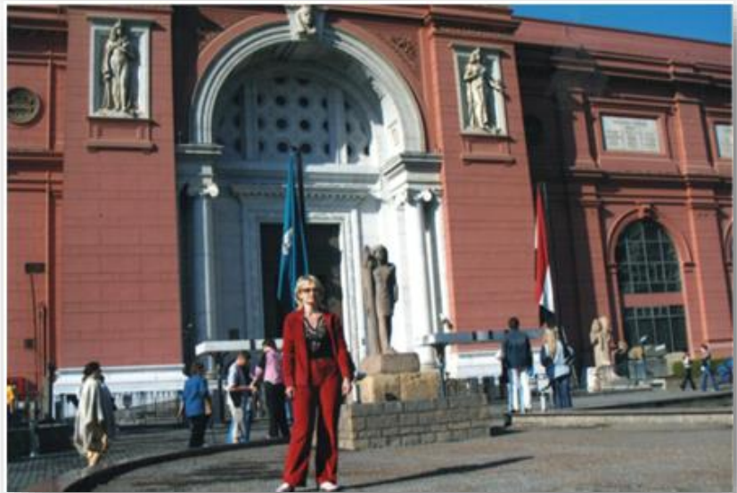
Каїр, Національний музей Єгипту, 2006 рік