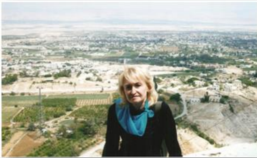
Іерусалим з висоти Гори Спокуси, 2010 рік