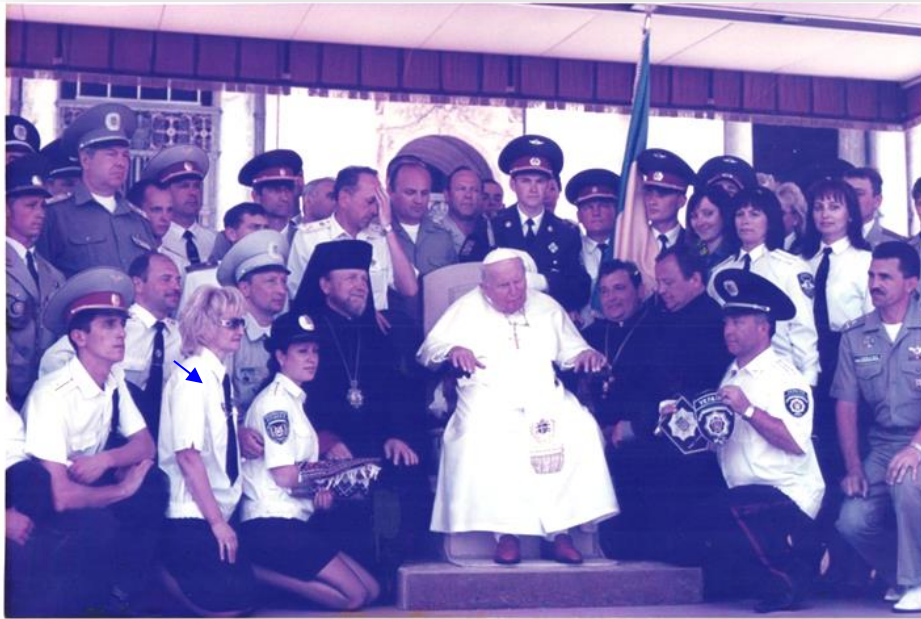
Військове паломництво до міста Лурд (Франція), травень 2004 року