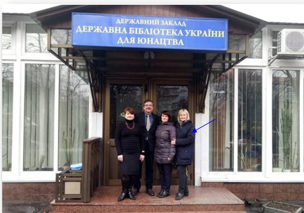
Обмін досвідом. Укладання угоди про партнерство. Березень, 2019 рік