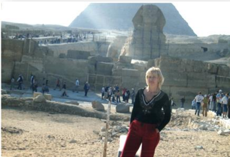
Єгипетські піраміди, 2006 рік