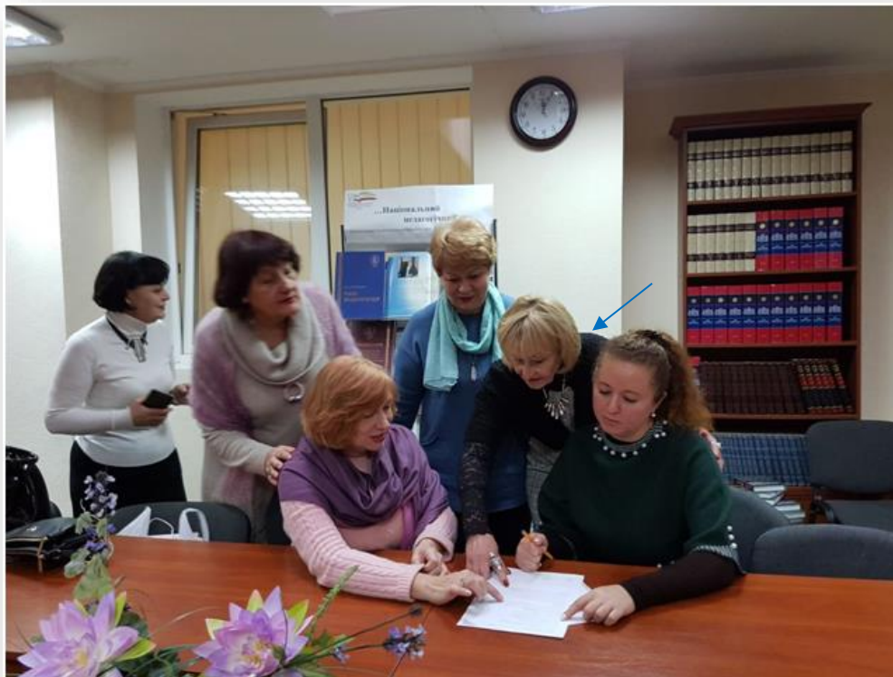
Національний педагогічний університет ім. Драгоманова. Обговорення проєкту «Зелені бібліотеки», 30.01.2020