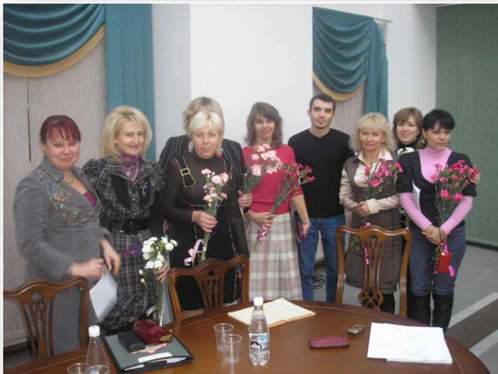
Проведення брейн-рингу спільно з науковим студентським товариством, 2009 рік