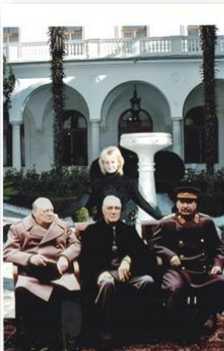
На території музейного комплексу Воронцовського палацу під час Міжнародної конференції «Бібліотеки та інформаційні ресурси в сучасному світі науки, культури, освіти та бізнесу», 2006 рік