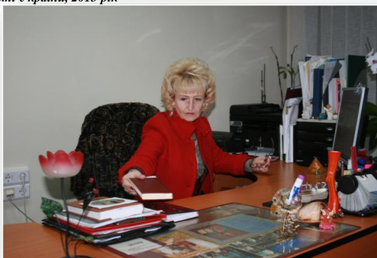
У робочому кабінеті, 2015 рік