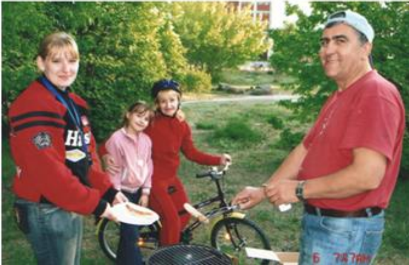
Берлін, 2005 рік