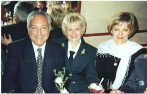
10 річниця утворення Податкової служби України