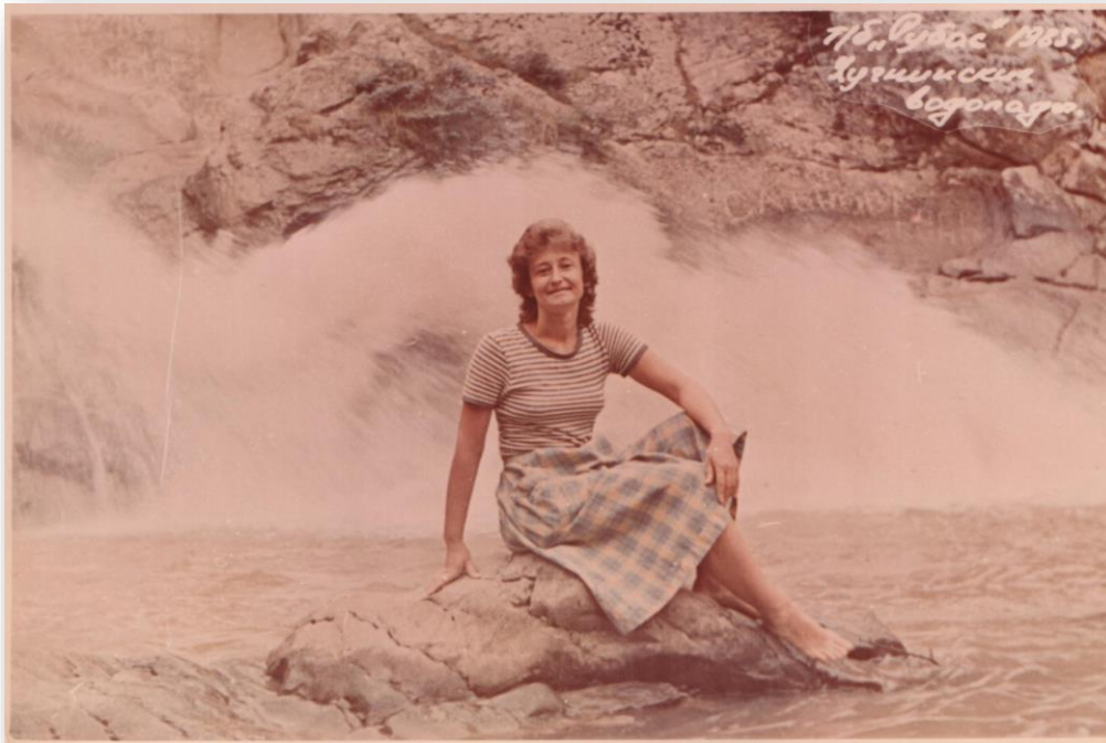
Хобі – пізнавати світ: Азербайджан, 1985 рік