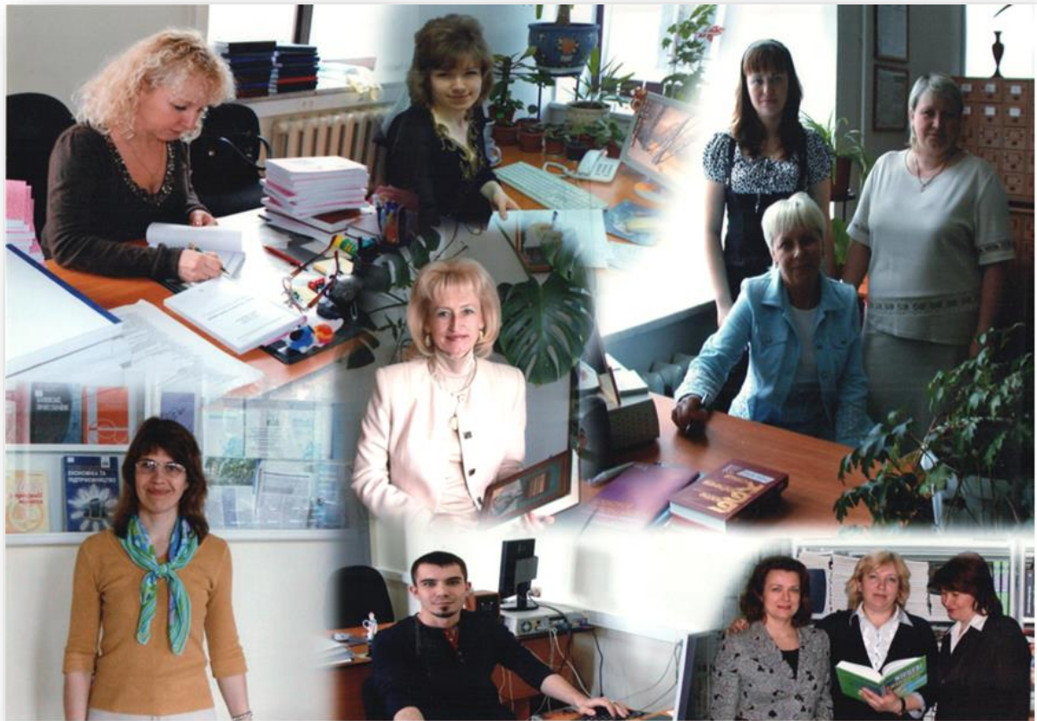
Бібліотечна родина, 2008 рік