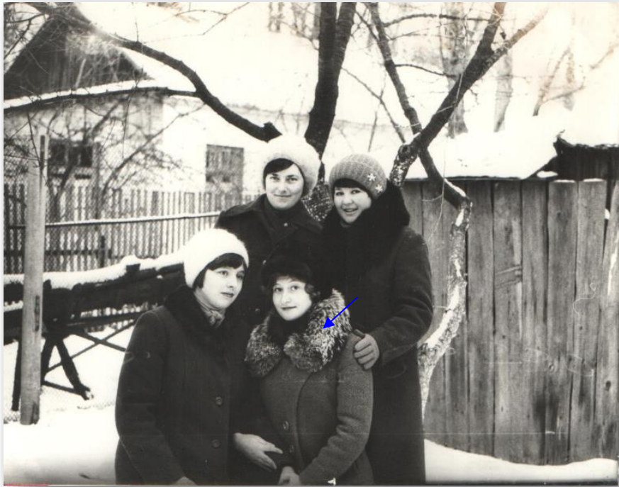
Найкращі подруги студентських років, 1978 рік